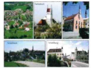
BUSFAHRPLAN 2018 Fahrplan für unsere Busse im Öffentlichen Personennahverkehr

In den letzten Tagen haben wir die aktuellen Exemplare des Busfahrplans 2018 erhalten. Das Heft ist gegen eine Schutzgebühr in Höhe 0,50 EUR zu erwerben. Die Fahrpläne erhalten sie im Rathaus, 1. Stock Zimmer Nr. 17 bei Frau Winkler.