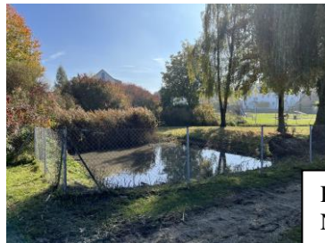
Hierweiher an der Niederfeldstraße