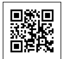
Projekt des Monats LPV-Landshut