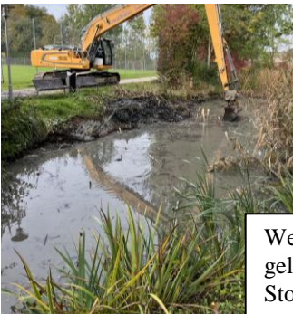
Weicher im Freizeitgelände bei den Stockbahnen